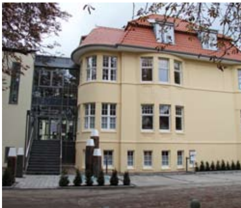
Niedersächsische Hafen-Zentrale, Oldenburg