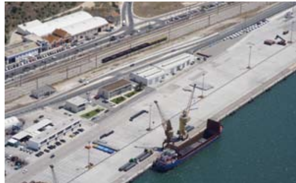
Teil des Hafens von Setúbal (Portugal)

Anfang September unterzeichneten Vertreter der Niedersachsen Ports GmbH & Co. KG und der Hafenbehörde des portugiesischen Hafens Setúbal (Administração dos portos de Setúbal e Sesimbra, SA) ein Partnerschaftsabkommen der Häfen Emden und Setúbal. Hauptziel des Abkommens ist die Förderung eines wirtschaftlichen, technischen und kulturellen Austausches im Bereich Hafenwirtschaft und Seeschifffahrt. Die Zusammenarbeit der jeweiligen Hafenvertretungen wird von der Untersuchung und Förderung der bevorzugten Seeverbindungen über den Austausch von statistischen Informationen, technischem Wissen und Ausrüstungen bis hin zur gemeinsamen Durchführung von Veranstaltungen gehen. Weiterhin beab-