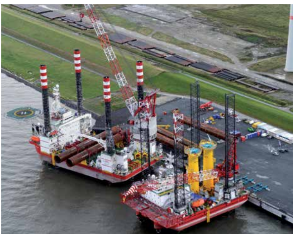
Offshore Basis Cuxhaven Offshore Base Cuxhaven

Six port locations under a single, joint management – we have the solutions to meet your demands. Please contact us.