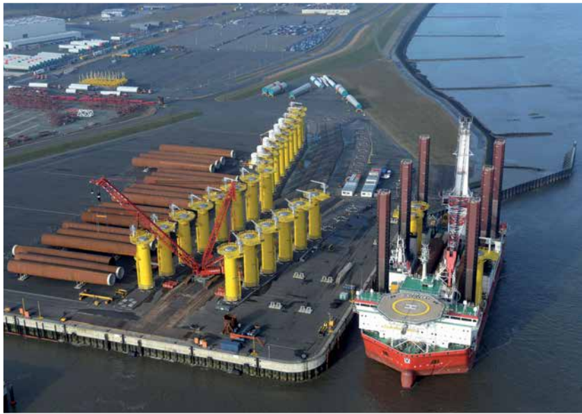
Offshore Basis Cuxhaven Offshore Base Cuxhaven