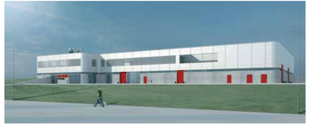
DONG Energy, Betriebsführungszentrale Main Office Norddeich Vom Norddeicher Hafen betreibt das dänische Unternehmen seine deutschen Offshore-Windparks. The Danish company is running its German Offshore Wind Parks from the port of Norddeich.